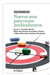
NUEVOS USOS PARA VIEJOS MEDICAMENTOS CAMPILLO MARTÍN, NURIA E. / FERNÁNDEZ ALONSO, MARÍA DEL CARMEN / JIMÉNEZ SARMIE