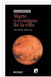
MARTE Y EL ENIGMA DE LA VIDA ÁNGEL VAQUERIZO, JUAN