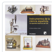
INSTRUMENTOS DE LA CIENCIA ESPAÑOLA MORENO GÓMEZ, ESTEBAN