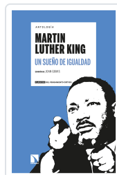
ANTOLOGÍA MARTIN LUTHER KING. UN SUEÑO DE IGUALDAD GOMIS, JOAN / DEL BUEY CAÑAS, RAMÓN