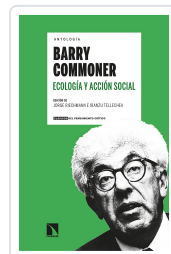
ANTOLOGÍA BARRY COMMONER ECOLOGÍA Y ACCIÓN SOCIAL RIECHMANN, JORGE/TELLECHEA, IRANZU