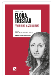
FEMINISMO Y SOCIALISMO TRISTÁN, FLORA