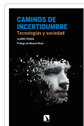
CAMINOS DE INCERTIDUMBRE PRADA, ALBINO