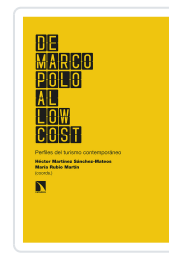
DE MARCO POLO AL LOW COST MARTÍNEZ SÁNCHEZ-MATEOS, HÉCTOR/RUBIO MARTÍN, MARÍA