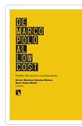
DE MARCO POLO AL LOW COST MARTÍNEZ SÁNCHEZ- MATEOS, HÉCTOR/RUBIO MARTÍN, MARÍA