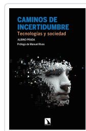
CAMINOS DE INCERTIDUMBRE PRADA, ALBINO