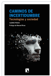
CAMINOS DE INCERTIDUMBRE PRADA, ALBINO