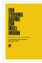
DE MARCO POLO AL LOW COST MARTÍNEZ SÁNCHEZ-MATEOS, HÉCTOR/RUBIO MARTÍN, MARÍA