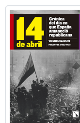
14 DE ABRIL CLAVERO MARTÍN, VICENTE