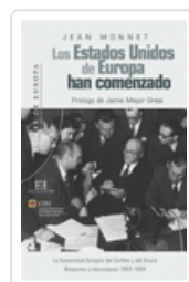
LOS ESTADOS UNIDOS DE EUROPA HAN COMENZADO ENCUENTRO