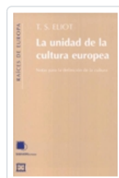
LA UNIDAD DE LA CULTURA EUROPEA ELIOT