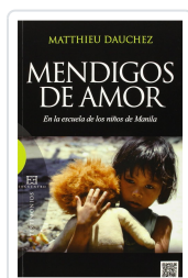
MENDIGOS DE AMOR DAUCHEZ, MATTHIEU