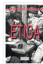
ÉTICA HILDEBRAND, DIETRICH VON