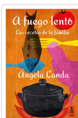
A FUEGO LENTO LANDA APARICIO, ÁNGELA