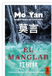
EL MANGLAR YAN, MO