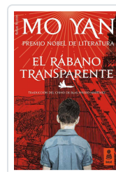
EL RÁBANO TRANSPARENTE YAN, MO