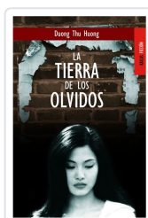
LA TIERRA DE LOS OLVIDOS DUONG THU HUONG