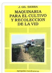
MAQUINARIA PARA EL CULTIVO Y RECOLECCIÓN DE LA VID GIL SIERRA, J.M.