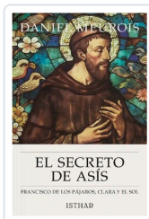
EL SECRETO DE ASÍS MEUROIS, DANIEL