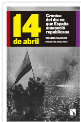
14 DE ABRIL CLAVERO MARTÍN, VICENTE