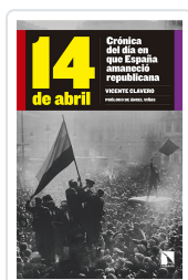
14 DE ABRIL CLAVERO MARTÍN, VICENTE