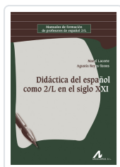
DIDÁCTICA DEL ESPAÑOL COMO 2/L EN EL SIGLO XXI LACORTE, MANEL