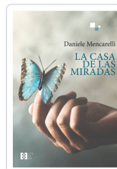
LA CASA DE LAS MIRADAS DANIELE MENCARELLI