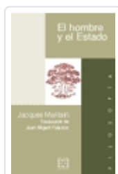
EL HOMBRE Y EL ESTADO JACQUES MARITAIN