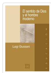
EL SENTIDO DE DIOS Y EL HOMBRE MODERNO GIUSSANI, LUIGI