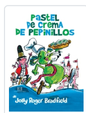
PASTEL DE CREMA DE PEPINILLOS JOLLY ROGER BRADFIELD