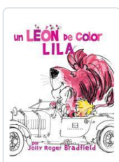
UN LEÓN DE COLOR LILA JOLLY ROGER BRADFIELD