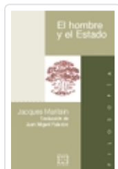
EL HOMBRE Y EL ESTADO JACQUES MARITAIN