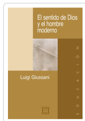
EL SENTIDO DE DIOS Y EL HOMBRE MODERNO GIUSSANI, LUIGI