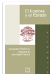
EL HOMBRE Y EL ESTADO JACQUES MARITAIN