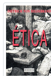
ÉTICA HILDEBRAND, DIETRICH VON