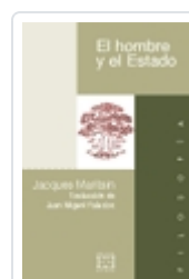
EL HOMBRE Y EL ESTADO JACQUES MARITAIN