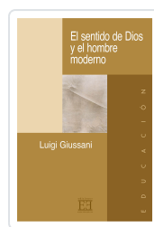
EL SENTIDO DE DIOS Y EL HOMBRE MODERNO GIUSSANI, LUIGI