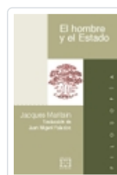
EL HOMBRE Y EL ESTADO JACQUES MARITAIN