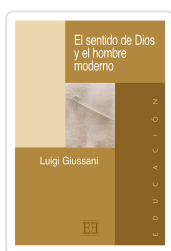
EL SENTIDO DE DIOS Y EL HOMBRE MODERNO GIUSSANI, LUIGI