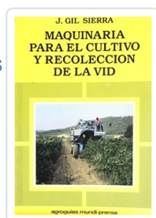
MAQUINARIA PARA EL CULTIVO Y RECOLECCIÓN DE LA VID GIL SIERRA, J.M.