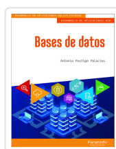
BASES DE DATOS POSTIGO PALACIOS, ANTONIO