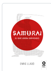
SAMURAI LLADÓ MICHELI, ENRIC