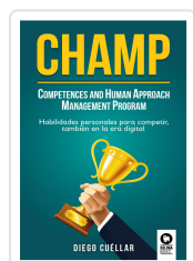
CHAMP CUÉLLAR, DIEGO