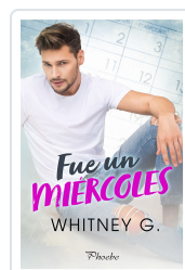
FUE UN MIÉRCOLES G., WHITNEY