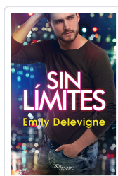
SIN LÍMITES DELEVIGNE, EMILY