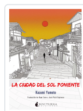
LA CIUDAD DEL SOL PONIENTE YUMOTO, KAZUMI