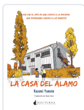
LA CASA DEL ÁLAMO YUMOTO, KAZUMI