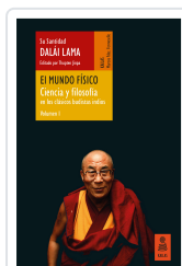
EL MUNDO FÍSICO (CIENCIA Y FILOSOFÍA EN LOS CLÁSICOS BUDISTAS INDIOS, VOL. 1) LAMA, DALÁI