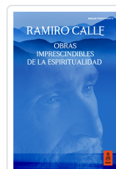
OBRAS IMPRESCINDIBLES DE LA ESPIRITUALIDAD CALLE CAPILLA, RAMIRO