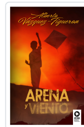
ARENA Y VIENTO VÁZQUEZ-FIGUEROA, ALBERTO