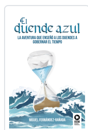
EL DUENDE AZUL FERNÁNDEZ-RAÑADA DE LA GÁNDARA, MIGUEL