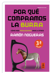
POR QUÉ COMPRAMOS LA BURRA NOGUERAS PÉREZ, RAMÓN