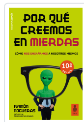
POR QUÉ CREEMOS EN MIERDAS NOGUERAS PÉREZ, RAMÓN