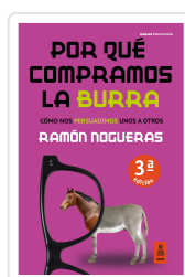
POR QUÉ COMPRAMOS LA BURRA NOGUERAS PÉREZ, RAMÓN