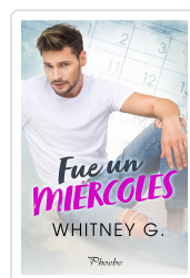
FUE UN MIÉRCOLES G., WHITNEY