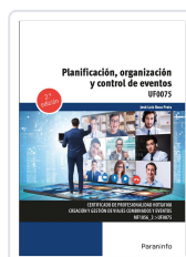
PLANIFICACIÓN, ORGANIZACIÓN Y CONTROL DE EVENTOS 2.ª EDICIÓN ROCA PRATS, JOSE LUIS