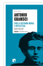
ANTOLOGÍA ANTONIO GRAMSCI PARA LA REFORMA MORAL E INTELLECTUAL GRAMSCI, ANTONIO