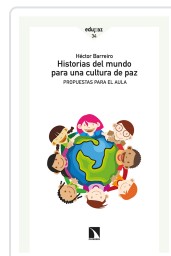
HISTORIAS DEL MUNDO PARA UNA CULTURA DE PAZ BARREIRO, HÉCTOR