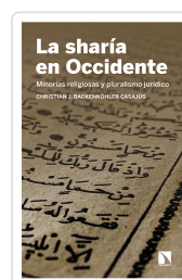
LA SHARÍA EN OCCIDENTE BACKENKÖHLER CASAJÚS, CHRISTIAN J.