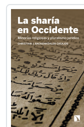
LA SHARÍA EN OCCIDENTE BACKENKÖHLER, CASAJÚS, CHRISTIAN J.