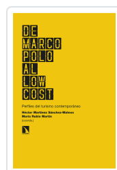
DE MARCO POLO AL LOW COST MARTÍNEZ SÁNCHEZ-MATEOS, HÉCTOR/RUBIO MARTÍN, MARÍA