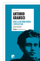
PARA LA REFORMA MORAL E INTELLECTUAL GRAMSCI, ANTONIO