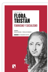
FEMINISMO Y SOCIALISMO TRISTÁN, FLORA