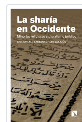
LA SHARÍA EN OCCIDENTE BACKENKÖHLER CASAJÚS, CHRISTIAN J.