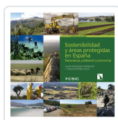
SOSTENIBILIDAD Y ÁREAS PROTEGIDAS EN ESPAÑA RODRÍGUEZ RODRÍGUEZ, DAVID/MARTÍNEZ VEGA, JAVIER