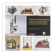
INSTRUMENTOS DE LA CIENCIA ESPAÑOLA MORENO GÓMEZ, ESTEBAN