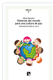
HISTORIAS DEL MUNDO PARA UNA CULTURA DE PAZ BARREIRO, HÉCTOR