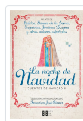
LA NOCHE DE NAVIDAD. CUENTOS DE NAVIDAD II GÓMEZ FERNÁNDEZ, FRANCISCO JOSÉ