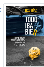
TODO IBA BIEN DÍAZ, ITXU